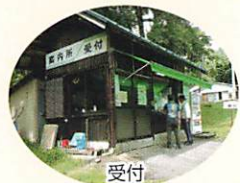
まずはココで受付を!